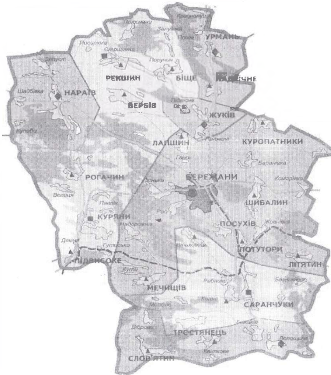
Карта спроможної мережі надання первинної медичної допомоги КНП «БЦПМСД»